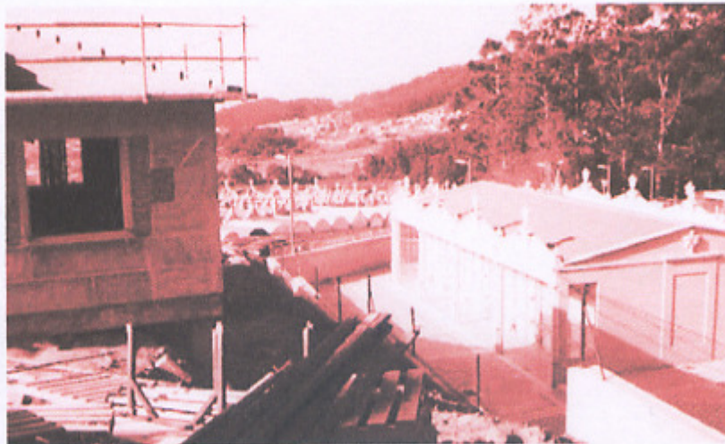
Las cuatro viviendas unifamiliares, que construye la sociedad Ferro Mesego, C.B. se sitúan, según el PSOE, a menos de 50 metros del recién inaugurado cementerio de Dorrón.