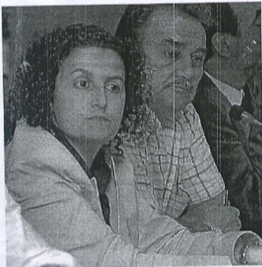
El grupo de gobierno rechazó varias mociones del PSOE

Tampoco sentó bien a los socialistas que no apoyaran su moción sobre la reparación de la carretera de Adina, así como la de Rouxique, "excusándose en que tienen una negociación con la